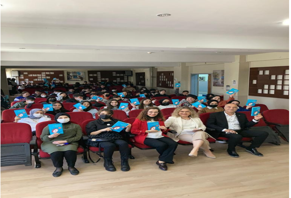
Okulumuz İstanbul’u Okuyorum programı